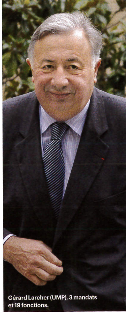
Gérard Larcher (UMP), 3 mandats et 19 fonctions.