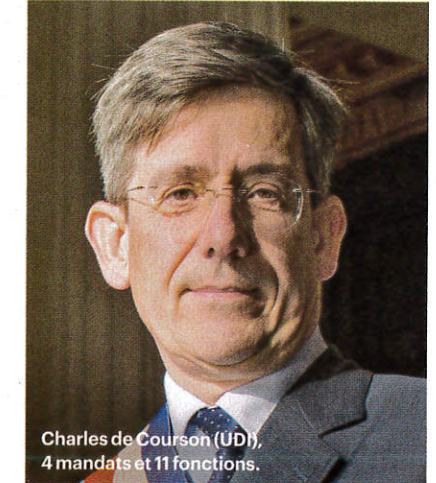
Charles de Courson (UDI), 4 mandats et 11 fonctions.