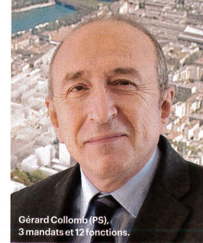
Gérard Collomb (PS), 3 mandats et 12 fonctions.